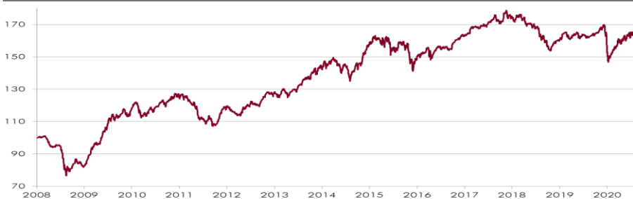
CHART WERTENTWICKLUNG NACH KOSTEN 1)