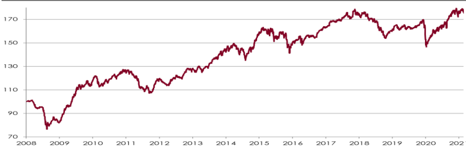
CHART WERTENTWICKLUNG NACH KOS 1)