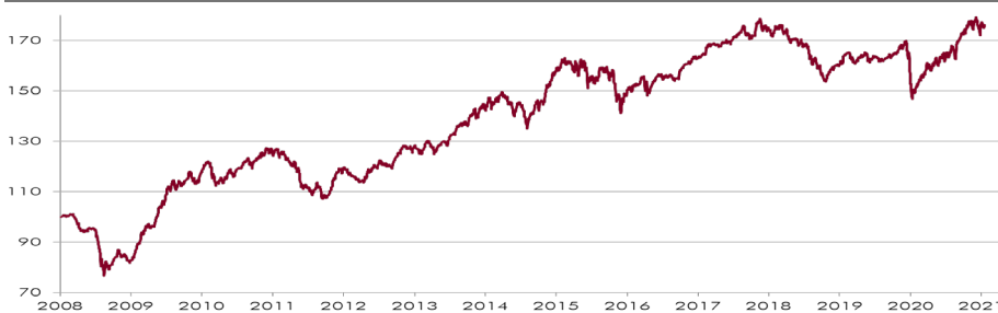
CHART WERTENTWICKLUNG NACH KOS 1)

Quelle: Convertinvest — CONVERTINVEST All Cap Convertibles Fund inst.