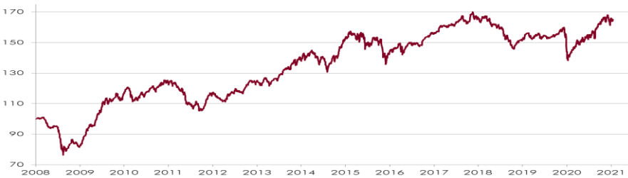
CHART WERTENTWICKLUNG NACH KOSTEN 1)