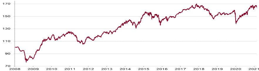
CHART WERTENTWICKLUNG NACH KOS 1)