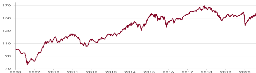
CHART WERTENTWICKLUNG NACH KOSTEN 1)