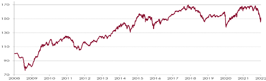
CHART WERTENTWICKLUNG NACH KOS 1)