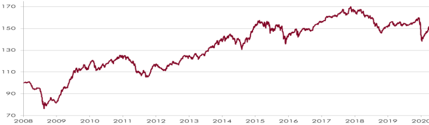
CHART WERTENTWICKLUNG NACH KOSTEN 1)