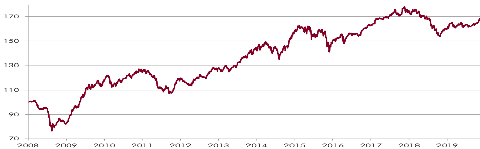
CHART WERTENTWICKLUNG NACH KOSTEN 1)