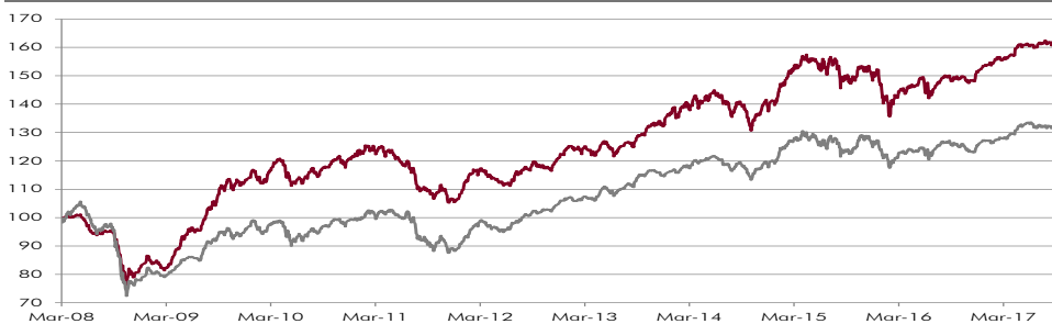
CHART WERTENTWICKLUNG NACH KOSTEN 1)

Quelle: Convertinvest — CONVERTINVEST All Cap Convertibles Fund — Vergleichsgröße **