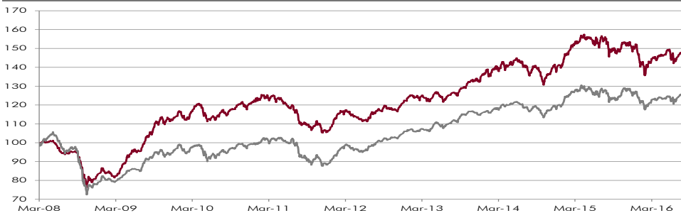
CHART WERTENTWICKLUNG NACH KOSTEN 1)

Quelle: Convertinvest — CONVERTINVEST All Cap Convertibles Fund — Vergleichsgröße**